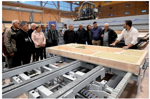
Wohneigentümer der Region Amriswil erhielten Ideen für den Bau und Umbau von Wohneigentum mit Holzmodulen.