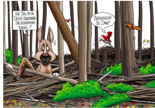
Mehr als 40 Prozent der bei uns vorkommenden Tiere und Pflanzen sind auf den Wald als Lebensraum angewiesen. Asthaufen spielen dabei eine wichtige Rolle. Cartoon: Silvan Wegmann

Vögel profitieren vom naturnahen Waldbau. Gemäss Vogelwarte Sempach hat der Bestand der Waldvögel seit 1990 um 20 Prozent zugenommen. Asthaufen begünstigen übrigens die Ausbreitung von Borkenkäfern nicht. Unsere häufigsten Borkenkäferarten mögen keine dünnen Äste, weil diese unter der Rinde zu wenig Platz für die Brutstube bieten und viel zu schnell austrocknen. Zudem beobachten Förster und Waldeigentümer die Situation laufend.