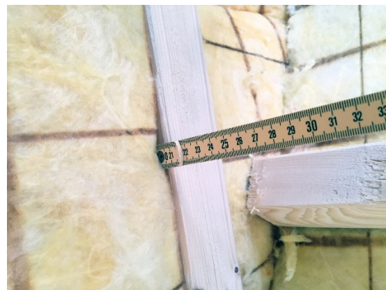
Bild: Dämmt ein Hauseigentümer das Einzelbauteil Dach, Wand oder Boden, hat er Anspruch auf einen Förderbeitrag pro Quadratmeter.

Informationen zum kantonalen Förderprogramm Energie sowie die Fördergesuche sind zu finden unter: www.energie.tg.ch > Förderprogramm